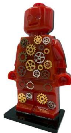
Alter Ego Gears 629