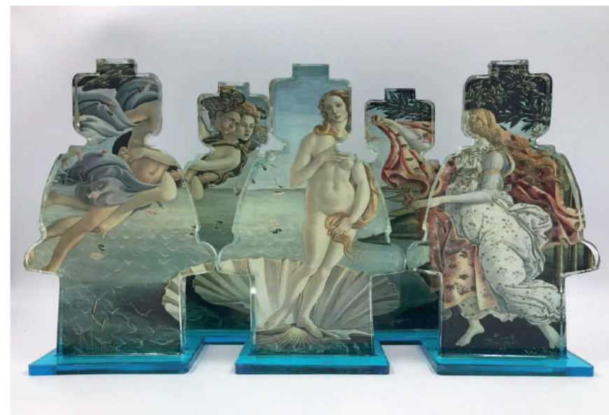
Alter Ego Birth of Venus 405 - 406 - 407 - 408 - 409

Gli AlterEgo diventano specchi emotivi per l'osservatore, spazi di riconoscimento e immedesimazione che pongono domande universali sul senso dell'esistenza, della relazione e della vulnerabilità umana.