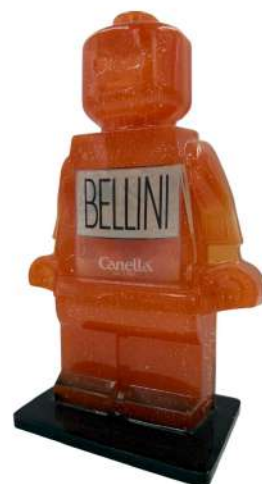
Alter Ego Bellini 542