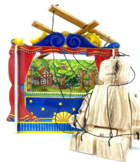
Alter Ego Puppet 750