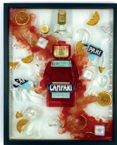
Alter Ego Broken Campari 833

Nascono così collaborazioni speciali che fondono personalità, culture e linguaggi in un'unica forma icona.