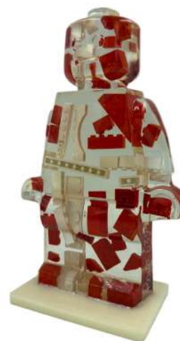
Alter Ego Denmark 639