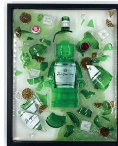
Alter Ego Broken Tanqueray 834