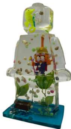
Alter Ego Alter Ego Governatore 498