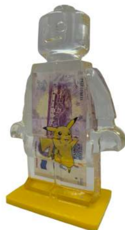
Alter Ego Firenze 709