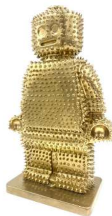
Alter Ego Diederik 520